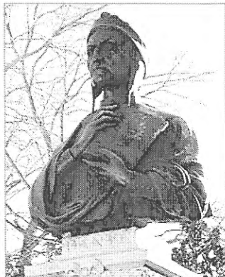
Buste de Dante en bronze sculpté par Maria Balboni, situé au parc La Fontaine en 1922 puis transporté au parc Dante en 1963 dans la Petite Italie

LES AMIS poètes remarquent ensuite le grand nombre de monuments dédiés à la poésie : Dante